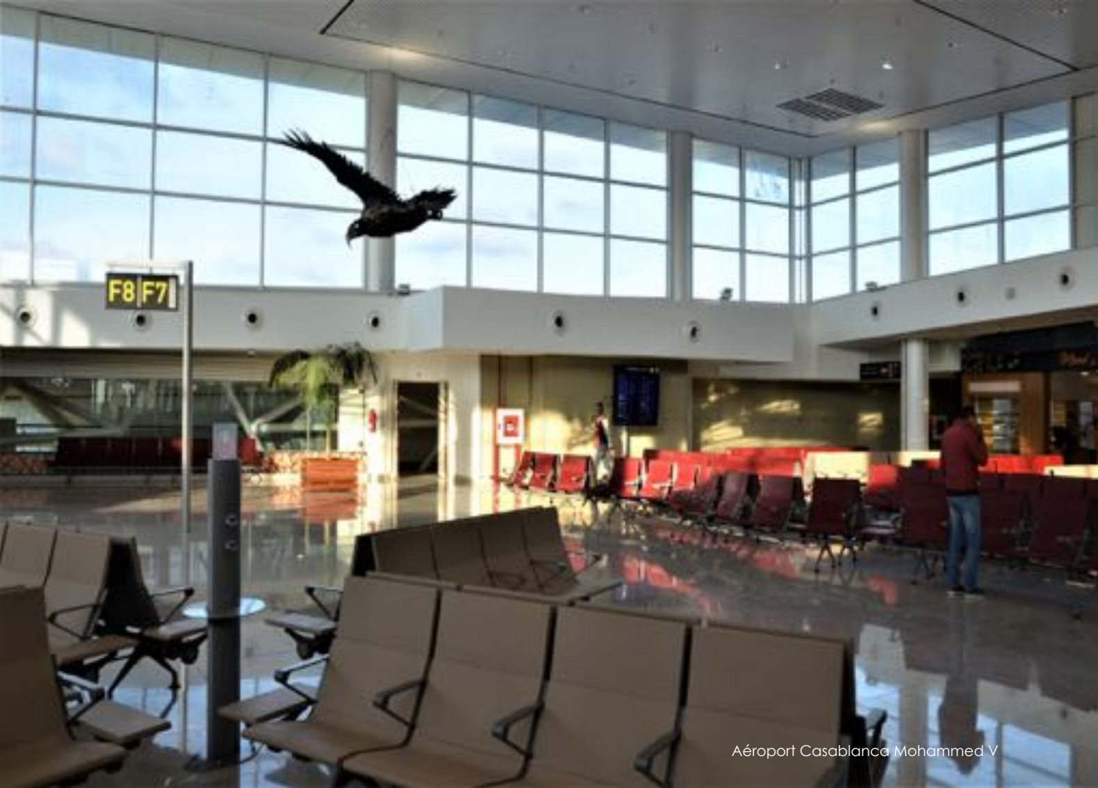
Aéroport Casablanca Mohammed V