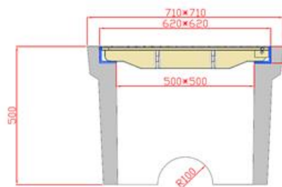
Figure à titre indicatif :